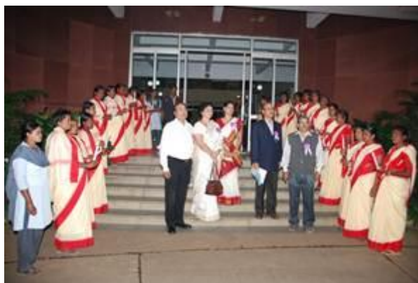
Здесь мы видим жертв насилия, стоящих в два ряда со свечами. Эти девочки не являются приемлемыми для их семей из-за клейма на них. Они остановились в доме для нищих.